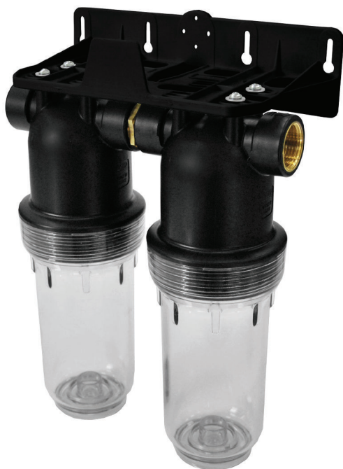
Contenitore per cartucce serie FP2 GIBO DUPLEX FP2 GIBO DUPLEX filter cartridge housing